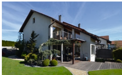
Mönchaltorf, Sternenweg: Verkauf Einfamilienhaus, 6 ½-Zimmer

Nachfolgend eine Auswahl verkaufter/vermittelter oder vermieteter Objekte