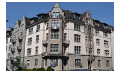
Zürich Färberstrasse: Vermietung Attika-Wohnung, 5 ½-Zimmer