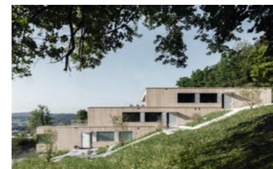
Winterthur, Landenbergstrasse: Verkauf 6 ½-Zimmer-Terrassenhaus