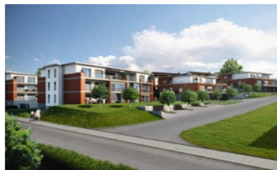
Hinwil, Chrüzacherstrasse: Erstvermietung von 18 Wohnungen, 3 ½ - 5 ½-Zimmer