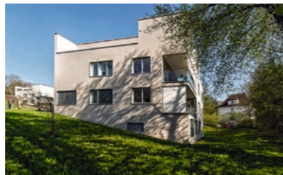
Winterthur Park Hochwacht: Verkauf 2 ½ - 4 ½ -Zimmer-Wohnungen