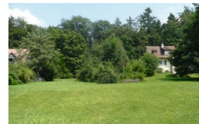
Zollikerberg: Verkauf Wohnbauland