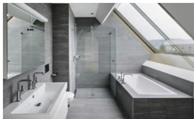
Winterthur, Gertrudstrasse: Entwicklung des Wohnbauprojektes inkl. Verkauf