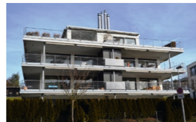
Zürich-Witikon, Carl Spitteler-Strasse: Verkauf Attikawohnung, 7 ½-Zimmer