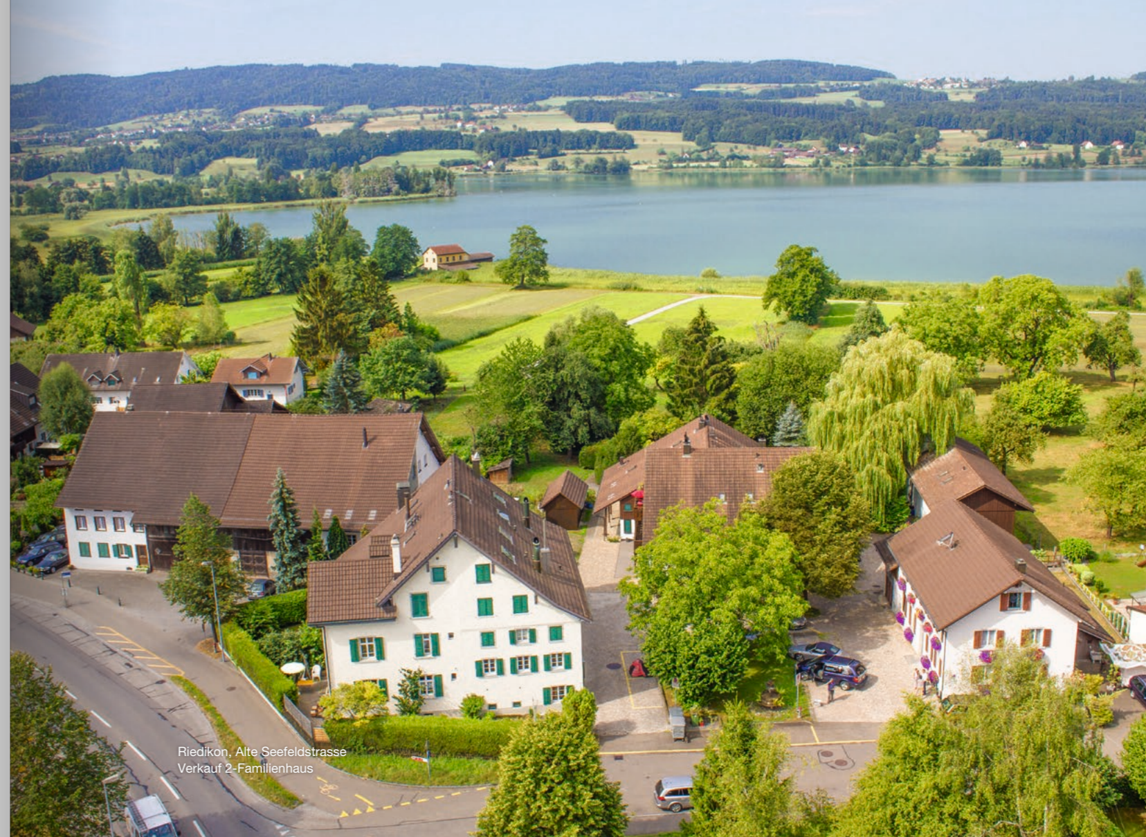
Riedikon, Alte Seefeldstrasse Verkauf 2-Familienhaus