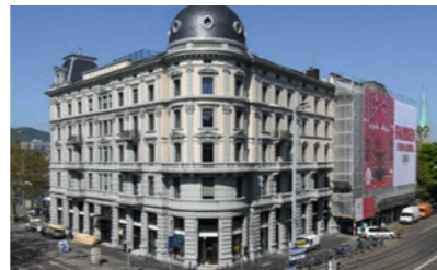
Zürich, Bellevuegebäude: div. Büroflächen, rd. 340 m 2