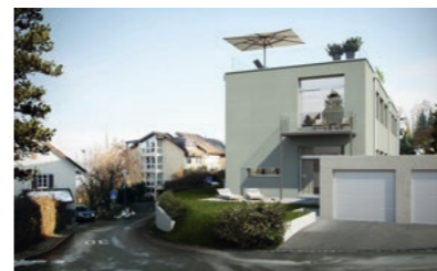
Horgen, Bergwerkstrasse: Verkauf Loftwohnungen