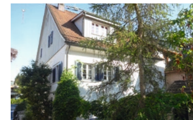
Zollikerberg, Wilhofstrasse: Verkauf Flarzhause